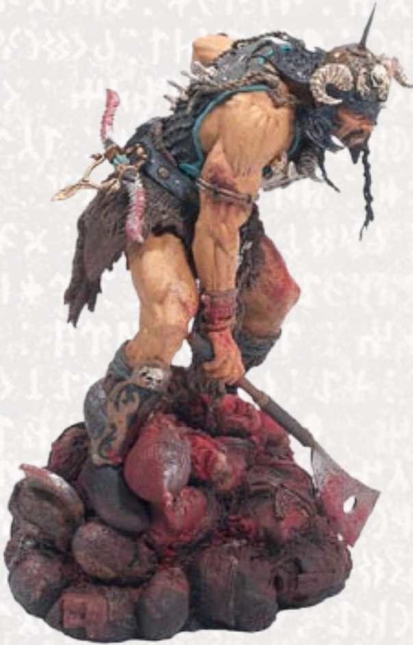
Avropalılar Atillanı bu gün də başkəsən cəllad kimi təsəvvürə gətirirlər.

Avropa tarixçilərinin qənaətlərinə görə ayrı-ayrı tay- falar şəklində götürəndə hunlar işlək, daim hərəkətli və tez-tez inamlarını dəyişən idilər. Hələ torpağa bağlan- mamışdılar. Həvişə səfərlərə hazırlaşır və növbəti daya- nacaqlarının uzun sürməməsi barədə düşünürdülər. Atlı tayfa sayılırdılar. Əyləncələri də, sevgiləri də at belində keçirdi. Bir-biriləri arasında mal dövriyyəsinə çıxarmağa əmlakları hələ yox idi. Bu səbəbdən də qarşılıqları çıxan yad kəndləri boşaldır, əllərinə nə keçirirdilərsə, hamısını