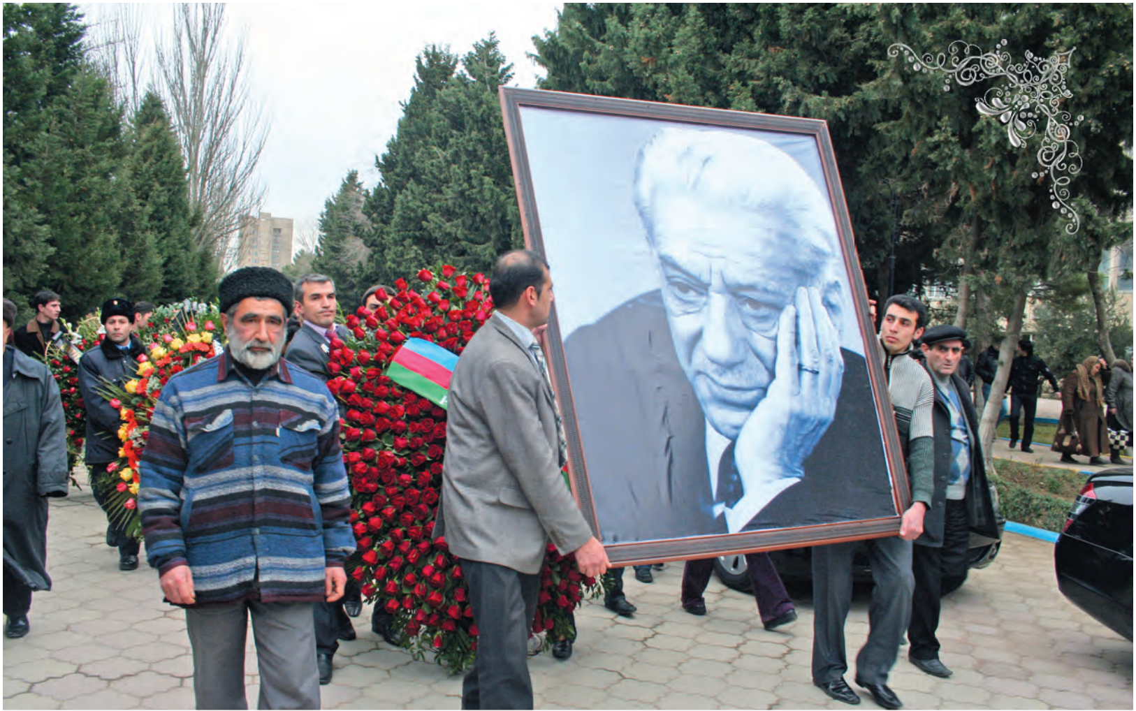
Hemıŝe trkly ile qrurlanan, «bir millt - iki dvlt» arzusuy-la yaŝayib-yaradan Bxtiyar Vahabzadnin kafni Azrbaycan v Trkiy dvltlerinin bayraqları oldu.